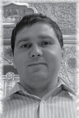
Дионисий - 14 февраля