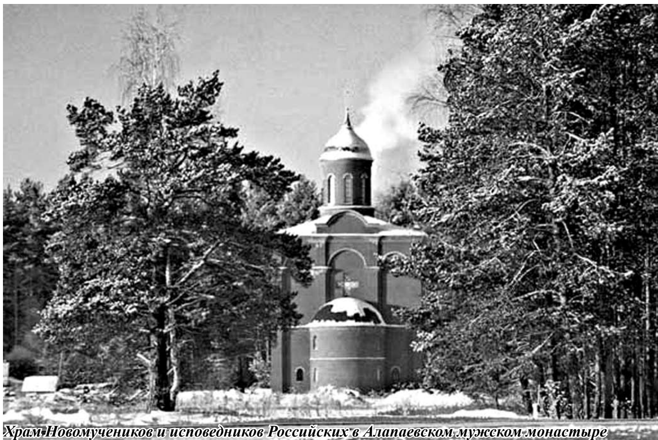
Храм Новомучеников и исповедников Российских в Алапаевском мужском монастыре