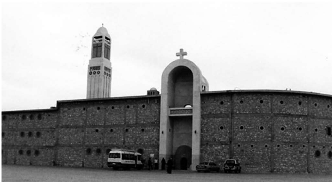
Высокими каменными стенами и узким входом обитель Абу-Макар (монастырь Макария Великого) внешне напоминает средневековый замок.