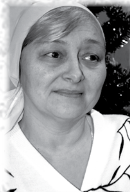
Любовь - 10 февраля