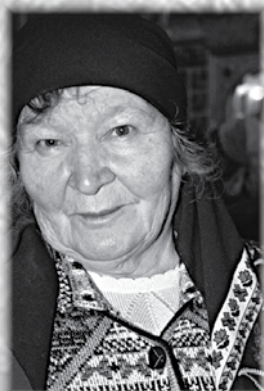
м.Любовь - 4 февраля