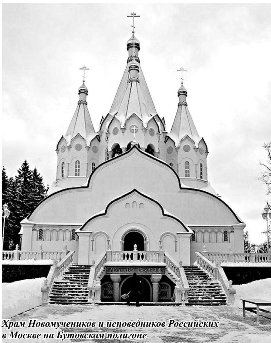
Храм Новомучеников и исповедников Российских в Москве на Бутовском полигоне

...На иконах новомучеников палачи изображаются в неизменных будёновках. В своё время художник Васнецов разработал для царской армии головной убор, похожий на шлемы древнерусских