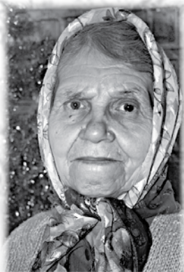
м.Фаина -13 февраля