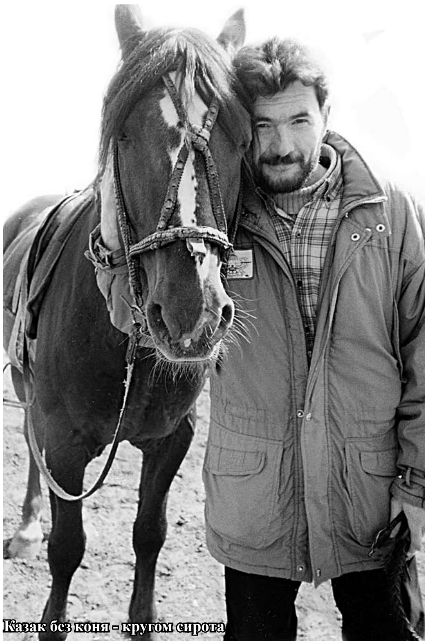
Казак без коня – кругом сирота

Так же точно осваивал. Не перевелись на Земле Русской гусли, и традиция игры на