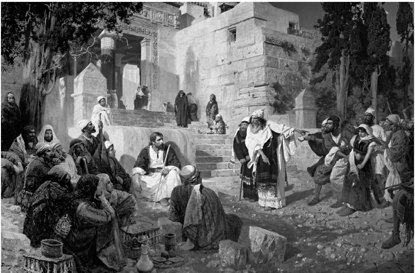
В.Д.Поленов «Христос и грешница»